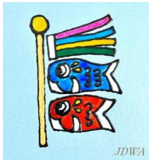
こいのぼりのスタンドグラス風デコ