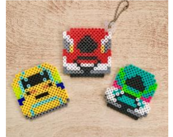
アイロンビーズ 新幹線 ネームプレート付き

ベースにラインストーンを貼って、キーホルダーに仕上げる。ネームプレートと組み合わせる。