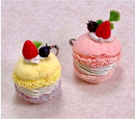
フェイクスイーツ マカロン