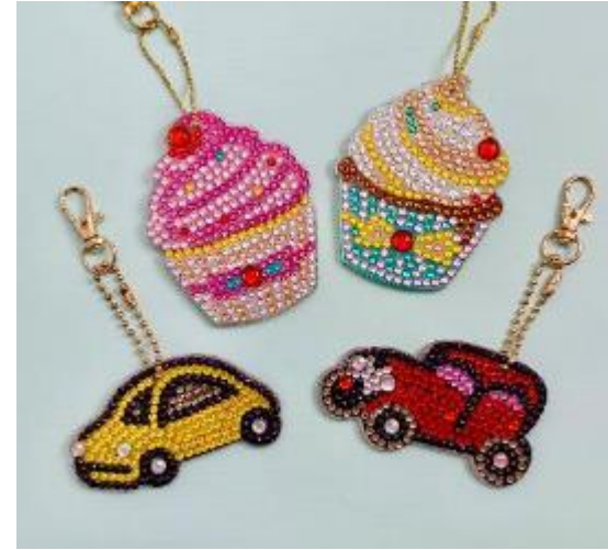
キラキラアートキーホルダー ネームプレート付き