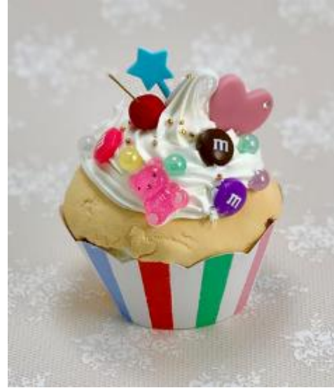
フェイクスイーツ カップケーキ