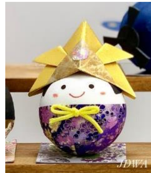
起き上がりこぼし かぶと

準備したベースの中を、専用のペンで塗る。持ち帰り後、窓ガラスなどに貼ることができる。